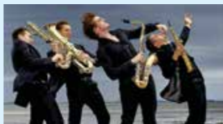
SIGNUM SAXOPHONE QUARTET