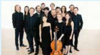
CHAARTS CHAMBER ARTISTS