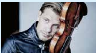
KIRILL TROUSSOV