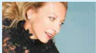
NATHALIE DESSAY