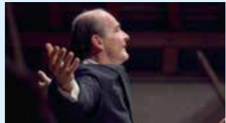
GÁBOR TAKÁCS-NAGY