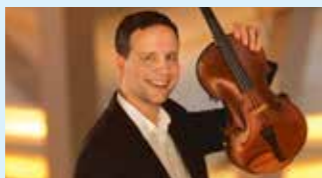
MATÉ SZÜCS © dr