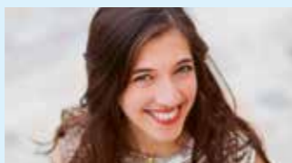
CAMILLE THOMAS