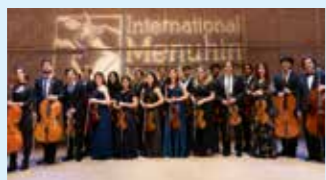
SOLISTES DE L'ACADÉMIE MENUHIN