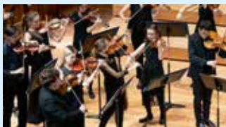
ORCHESTRE DE CHAMBRE DE LA HEM